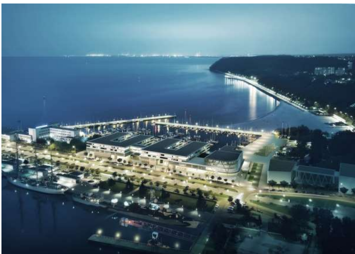
Wizualizacja projektu "NOWA MARINA GDYNIA"